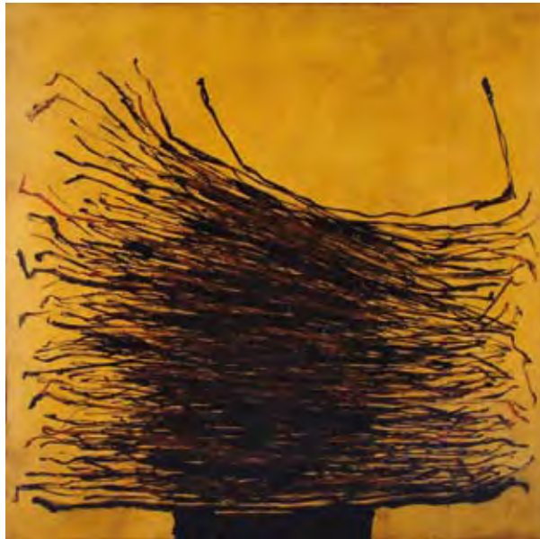
Case à palabre - Pigments à l'huile sur bois - 2004

Avec le concours de la galerie Arts Pluriels La Cuverie