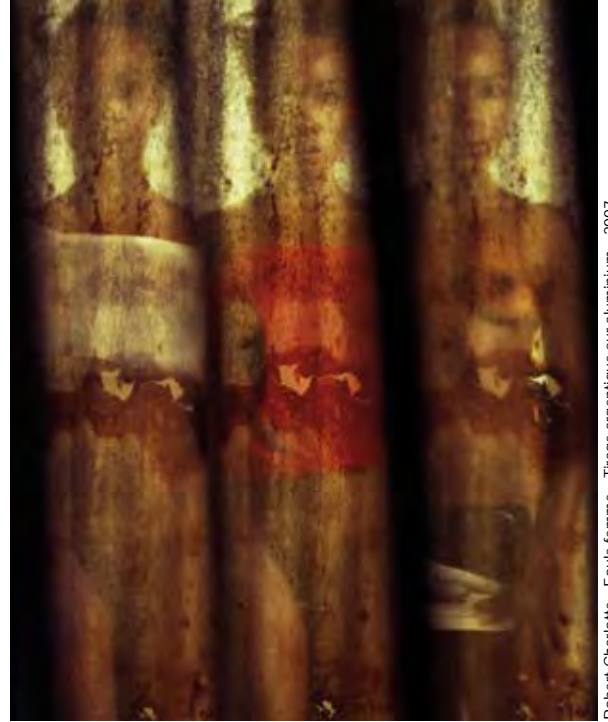
Robert Charlotie - Foule femme - Tirage argentique sur aluminium - 2007.

Nous sommes certes à un moment de transition, mais convaincus que la singularité des regards montrés, ainsi que chacune des images, feront sens et dialogueront entre elles.