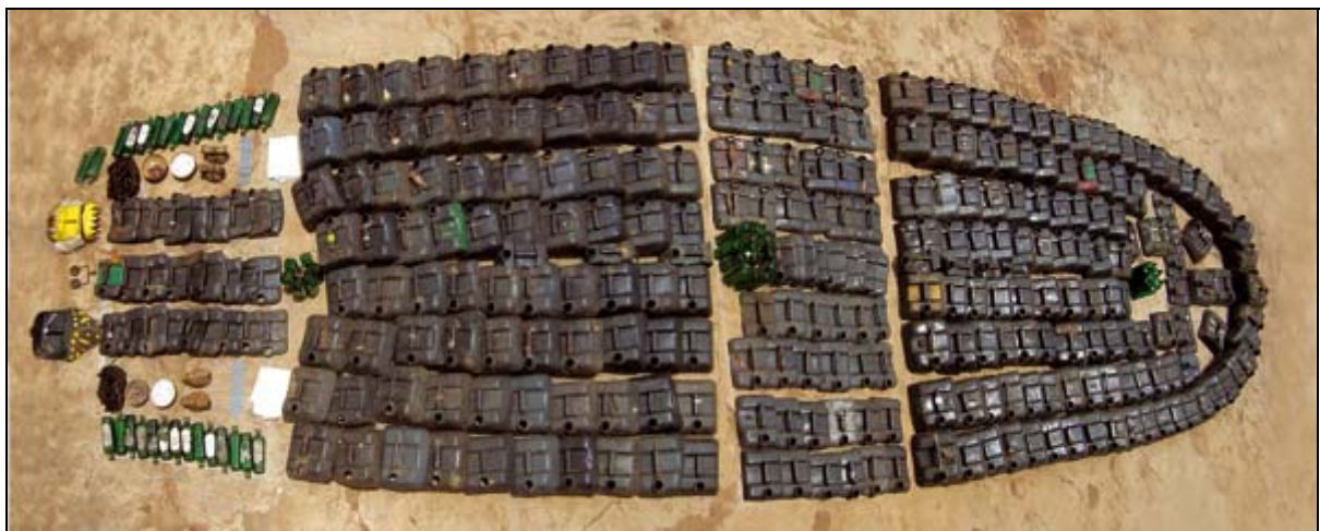
La Bouche du Roi photo © Romuald Hazoumé

Romuald Hazoumé s'est inspiré d'une célèbre gravure du XIXe siècle qui représente un bateau négrier en plan de coupe et la manière dont les esclaves sont « disposés » dans les soutes.